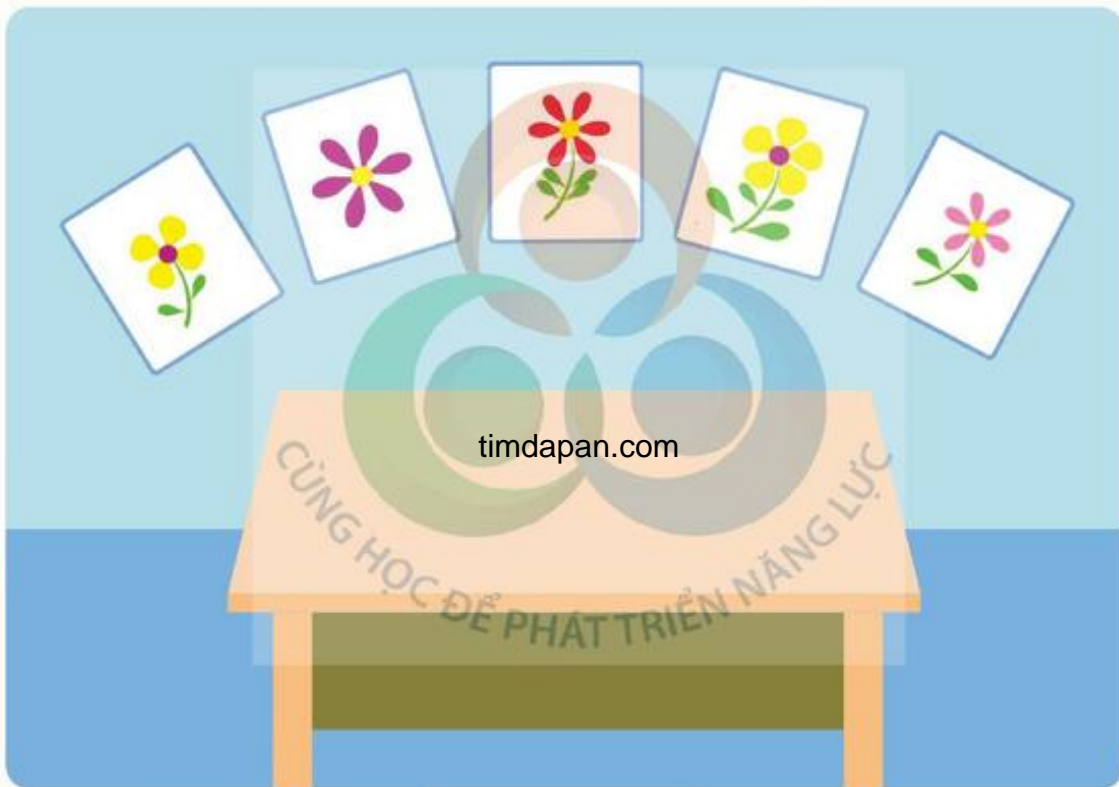
Hình tham khảo