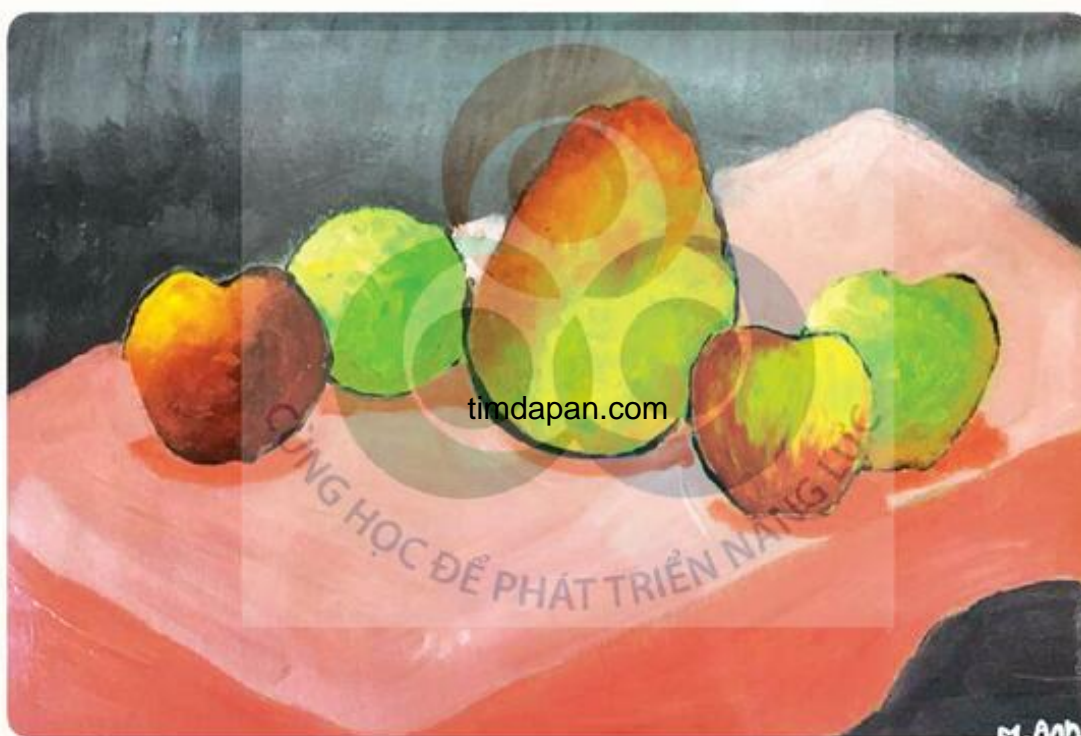
Quả, tranh bột màu, Minh Anh