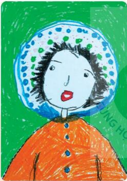
Cô giáo em, tranh sấp màu, Anh Tuấn

Chấm và nét đã tạo nên những hình vẽ gì? Em hãy chỉ cho bạn biết những chấm và nét có trong hai bức tranh phía dưới.