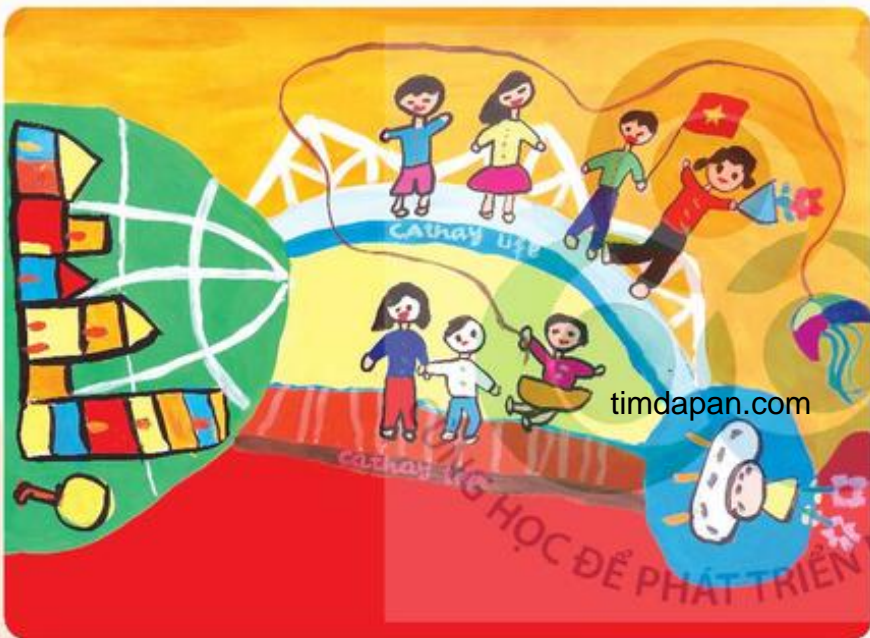
Đến thăm hành tinh mới, tranh bột màu, Bảo Long

Trong 2 bức tranh sau, bạn đã dùng nét vẽ được những hình ảnh nào?