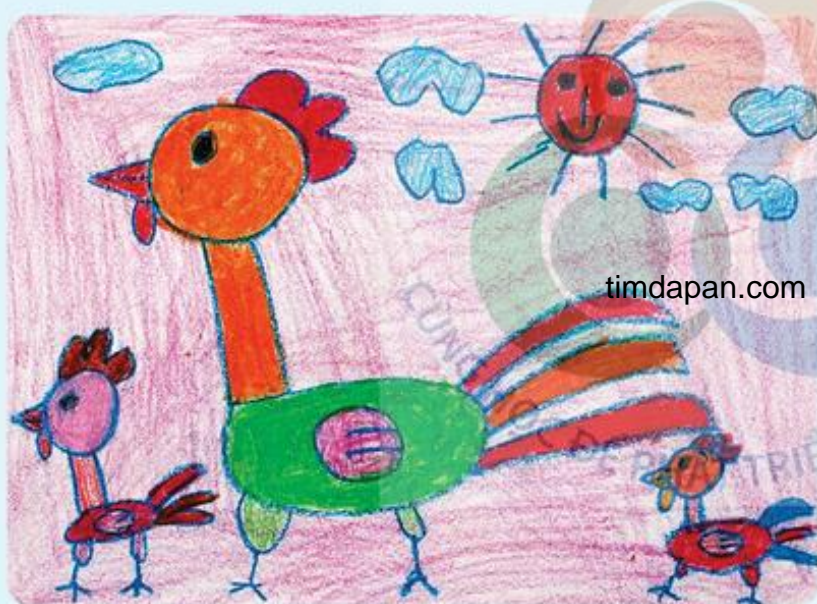
Đàn gà, tranh sếp màu, Minh Trang

Em hãy cho biết các sản phẩm mỹ thuật sau đây được làm từ đồ dùng học tập, vật liệu nào của môn Mỹ thuật?