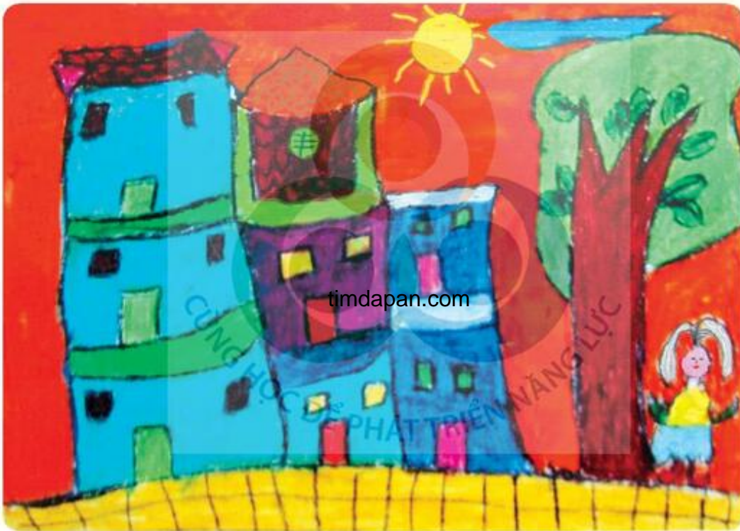
Nhà phố cổ, tranh sếp màu, Minh Phương