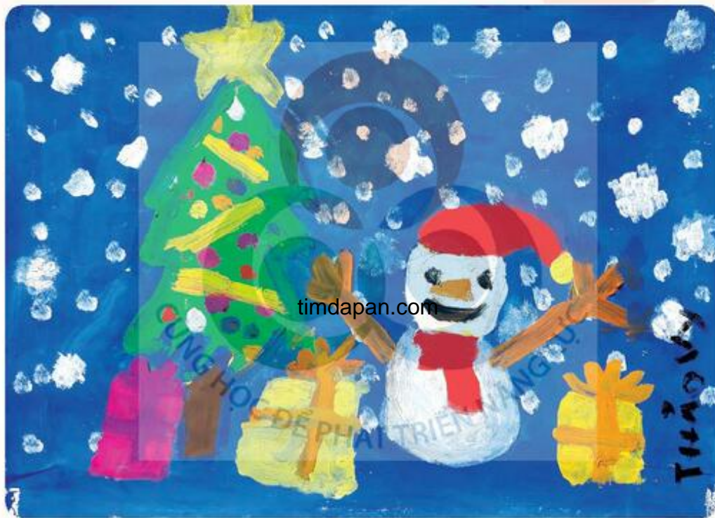
Đón Giáng sinh, tranh bột màu, Thảo Vy

Em hãy quan sát bức tranh để nhận biết chấm đã tạo được hình nào và có màu gì?