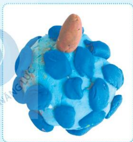
Quả na, đất nặn, Huy Dũng