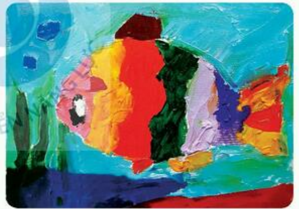
Cá, tranh màu a-cờ-ry-lic, Đức Huy