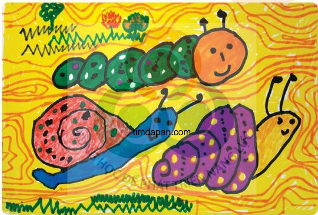
Con ốc sên, tranh màu dạ, Bích Ngọc