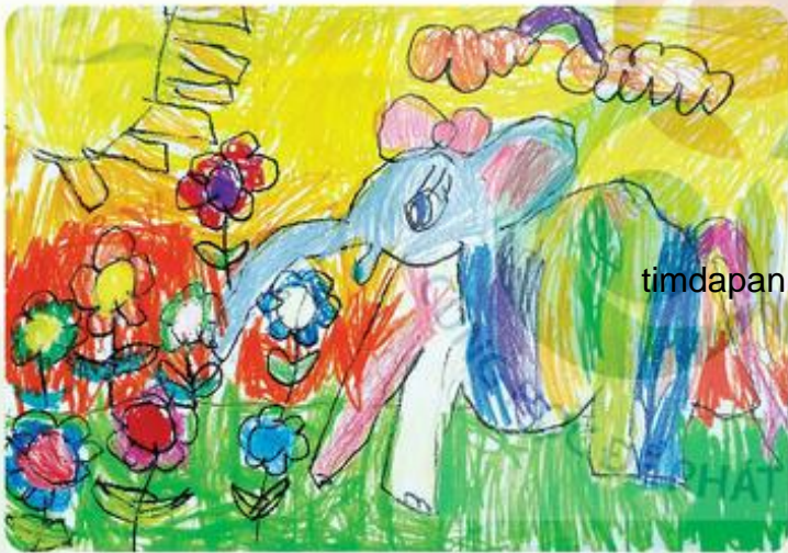
Chú voi, tranh chì màu, Tiên Nhi