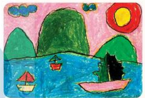
Thuyền và núi, tranh sáp màu, Tuấn Hưng