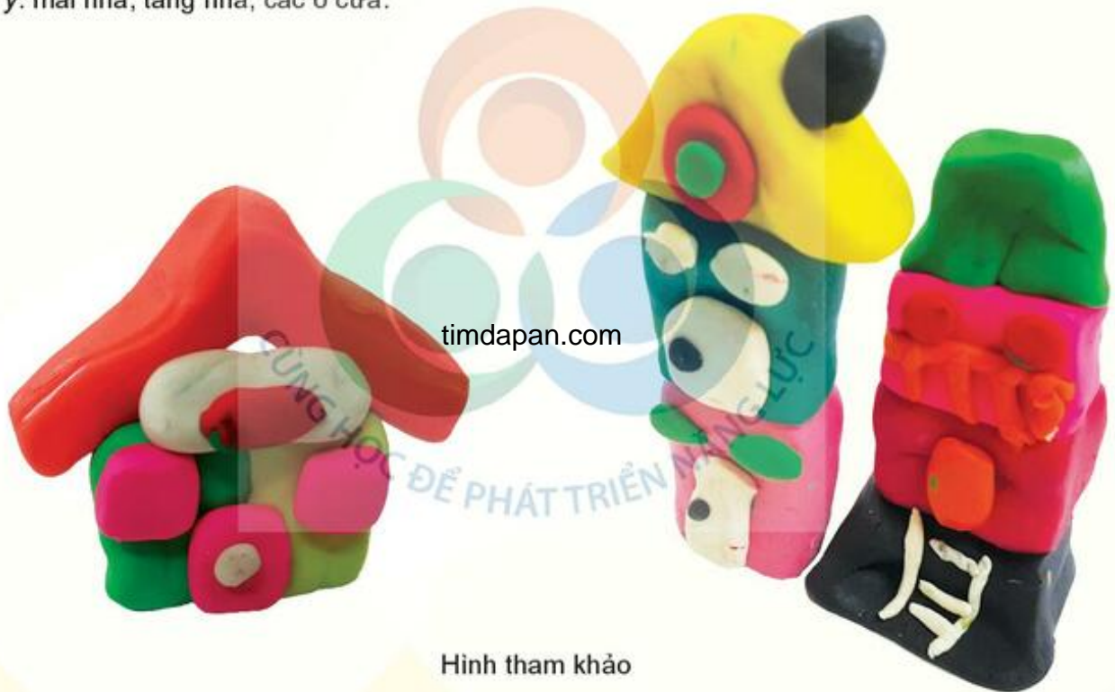
Hình tham khảo