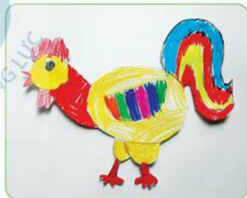
Hình tham khảo