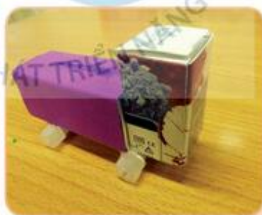
Hình tham khảo