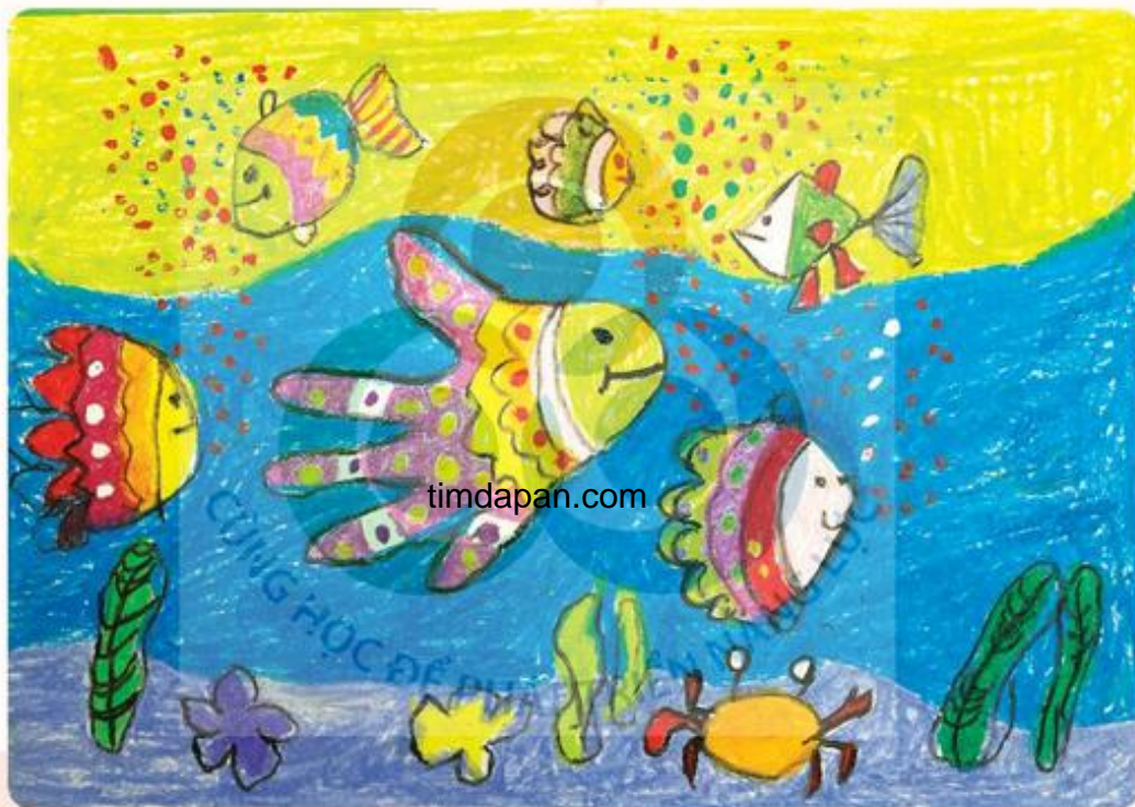
Đàn cá, tranh sếp màu, sản phẩm của nhóm Hoa Hương Dương

Em hãy phát hiện chấm, nét và màu xuất hiện ở hình vẽ nào trong các bức tranh sau.