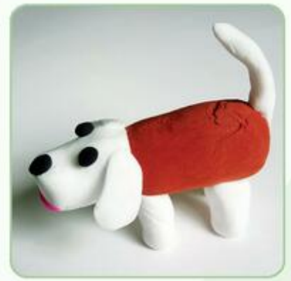
Hình tham khảo