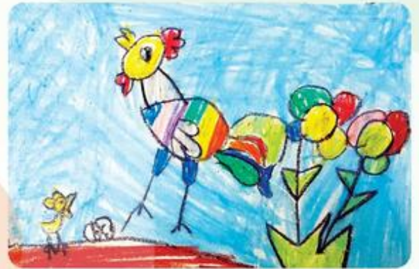
Gà mẹ và gà con, tranh sáp màu, An Khang